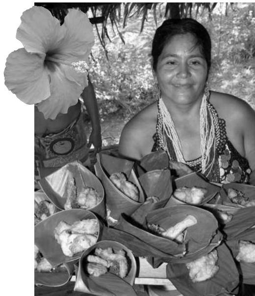
Indienne Embera offrant du poisson tilapia frit avec des bananes plantain dans des feuilles de bananier