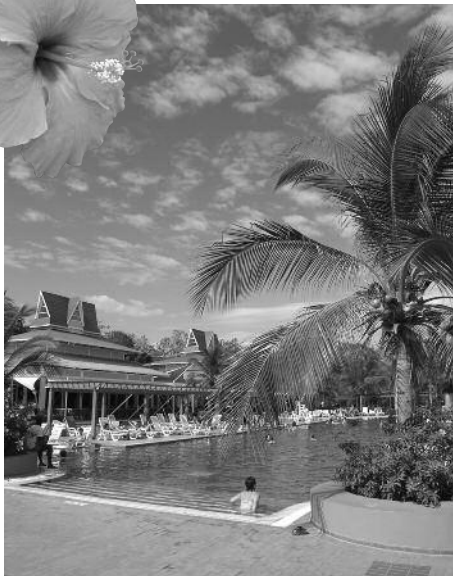
Piscine devant le restaurant Atlantis du Royal Décameron de Playa Blanca

froid avec oignons, concombres et citron, etc. La base de l'alimentation reste le maïs. Il y a beaucoup de poissons et ils ont un très bon riz qu'ils exportent même à l'extérieur.