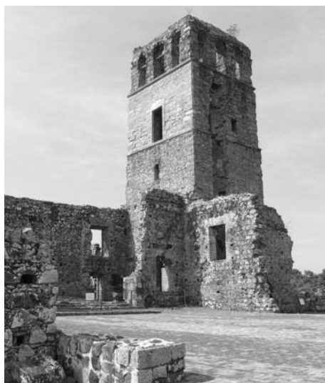
Cathédrale de Panama la vieille