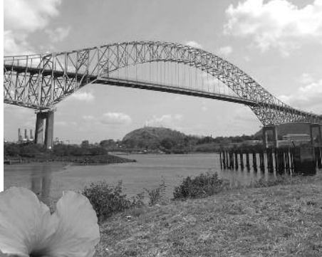
Pont des Amériques