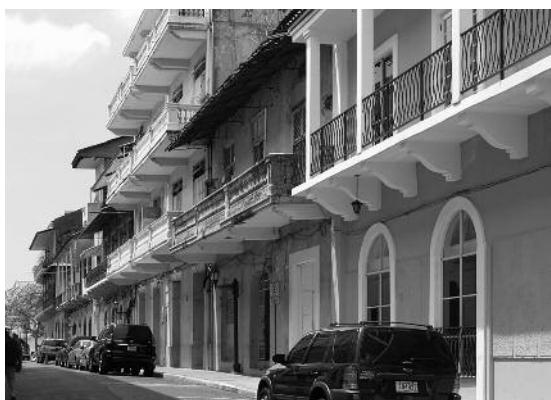
Quartier du Panama colonial