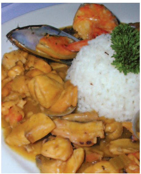
Delicia de mariscos al portobello

Nous recommandons une visite au restaurant Las Tinajas (★★ Debeur), Calle 51, Bella Vista. On y sert une cuisine typiquement panaméenne tout en y offrant un spectacle de danse folklorique de très bonne qualité avec la troupe Panamai Ritmos e Tambolles . Essayez aussi l'un des restaurants de cuisine rapide de la chaîne Niko's