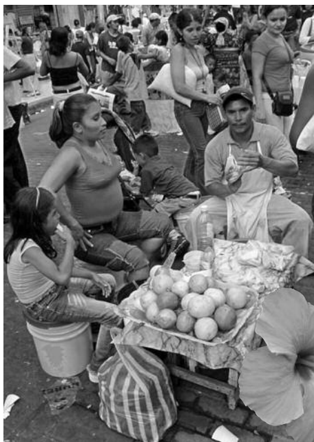
La Peatonal, une rue très animée