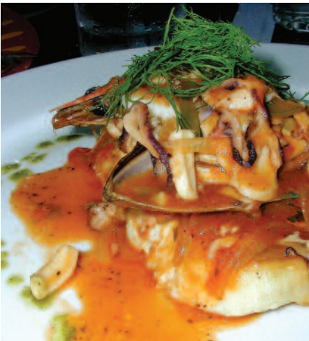
Filet de poisson avec fruits de mer à la sauce tomate piquante riz et pesto (Berrugate a lo macho)

Originaire de Colombie, la tendance cuisine à Panamá est actuellement un mélange de nourriture des Caraïbes et des Amériques. Plus traditionnellement, on y trouve le foie de bœuf avec beaucoup d'oignon, les Empanadas, le Bollos (maïs bouilli), la soupe panaméenne (poulet, yam ou patates et oregano), les Tamales (maïs en purée, cuit dans des feuilles de bananier avec des oignons, du poulet ou du porc), la soupe