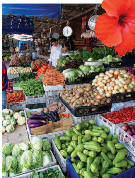
Marché de fruits et légumes à Panama