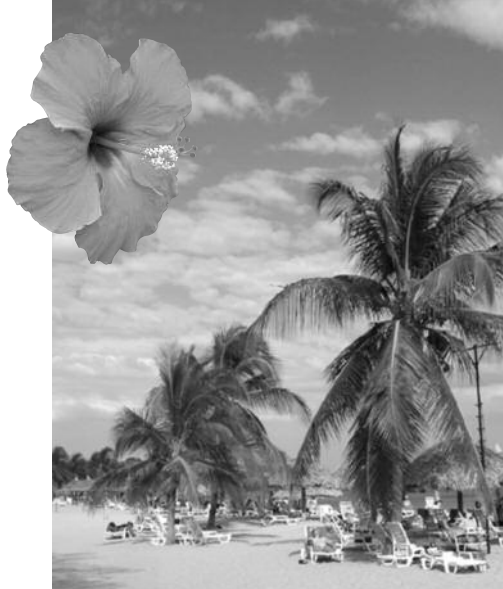
Plage de sable fin de Playa Blanca

Lorsque la Vieille ville fut brûlée, en 1671 par le pirate Morgan , les habitants reconstruisirent Panamá à huit kilomètres plus au nord. C'est ce qu'on appelle aujourd'hui Panamá colonial . Entre les deux, se situe la ville moderne avec son centre d'affaires et