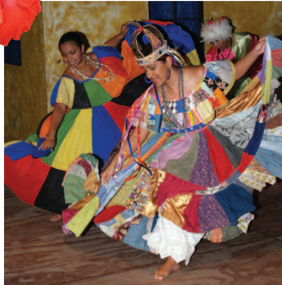
Groupe de danse Panamai Ritmos & Tambolles

San Cocho, (blé et poulet avec du miamie et du coriandre frais). Il y a aussi le riz au poulet, le porcelet rôti, le Mondongo criollo (tripe de bœuf, les Tortillas de maiz nuevo (frais), les Carimanolas (yuka moulu avec de la viande), le Mamallena (pudding au pain et raisins), la Bienmesabe (sorte de crème renversée ou flan), les Patacowes (plantin tapé), le Guacho (fruits de mer et riz mélangés un peu comme une soupe), le Cuisado de mariscos Costa Blanca (fruits de mer aux oignons et tomates), le Tasajo ahunmado a la chiricana (estouffade de bœuf fumé en sauce), Pied de porc servi