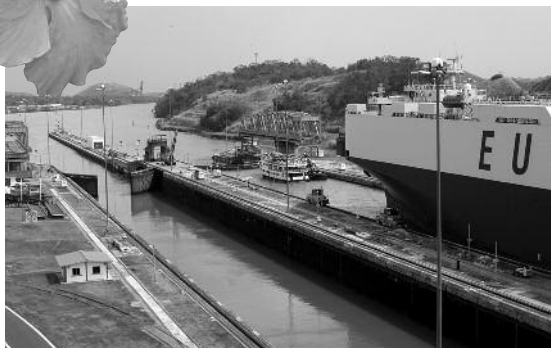
Canal de Panama