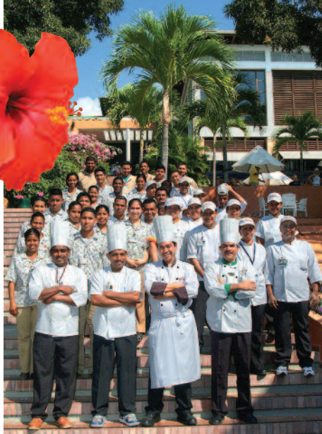
Brigade des cuisines de l'Hôtel Royal Décameron,

tre chefs. Ici, on est au cœur de la grande ville, mais avec des dimensions humaines. C'est tout à la fois un centre d'affaires international et un centre de villégiature avec sa vieille ville, sa ville coloniale et, entre les deux, la ville moderne. Tout y est bon marché. Un passage d'autobus dans les fameux "diablos rouges" qui roulent comme des fous, au son d'une disco tonitruante, où vous devez hurler "parada" de toutes vos forces pour le faire arrêter, ne coûte que 25¢US, et vous payerez 1,25$US pour un trajet en taxi. Un CD de musique peut vous être proposé pour 3,50US. Et tout est à l'avenant.