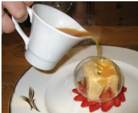
Dessert: La fraise en transparence, gourmandise d'agrumes préparée à votre table (restaurant La Palme d'or)

À proximité de Cannes, au pied de L'Estérel (massif des Maures), les frères Raimbault y travaillent avec passion. Trois chefs, deux cuisiniers, Stéphane et An-