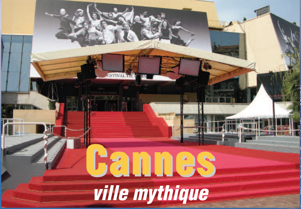
Le célèbre Palais des Festivals