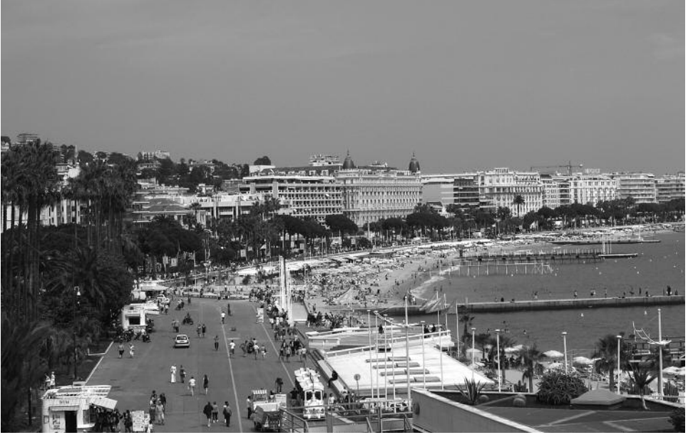
Célèbre promenade de La Croisette, bordée de palaces comme Le Carlton (avec les deux ogives) et le Martinez

Cannes, élégante et versatile, joyau de la Côte d'Azur, étincelle de tous ses feux le temps des festivals: festival du cinéma, festival du disque... Les rayons du soleil dégoulinent des collines pour embraser le vieux quartier du Suquet, et ensuite couler le long du boulevard de La Croisette. Il faut admettre qu'elle a tout pour séduire: un arrière-pays qui sent bon la Provence, une vieille ville pleine de charmes anciens, une ville moderne émaillée de curiosités et de gourmandises, un marché de fruits et de légumes du pays, de fruits de mer et de poissons, ouvert toute l'année.