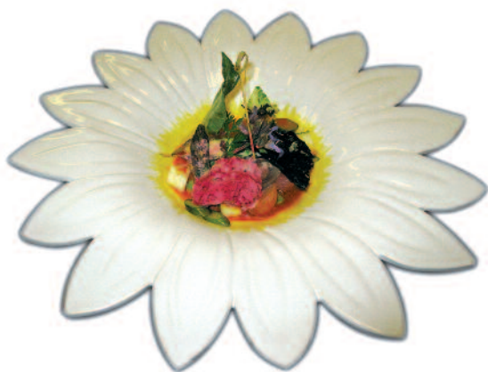
Assiette pâquerette: Langoustine rôtie, glace fondue comme une bisque, voile blanc parfumé aux feuilles de verveine et brunoise de melon gorgé de soleil