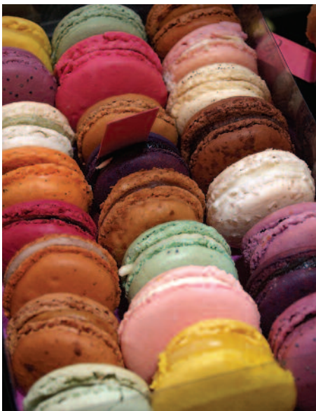
Macarons de la Chocolaterie et pâtisserie Jean-Luc Pelé