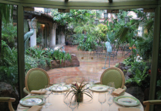
Salle à manger du restaurant L'Oasis, s'ouvrant sur un magnifique jardin d'été.