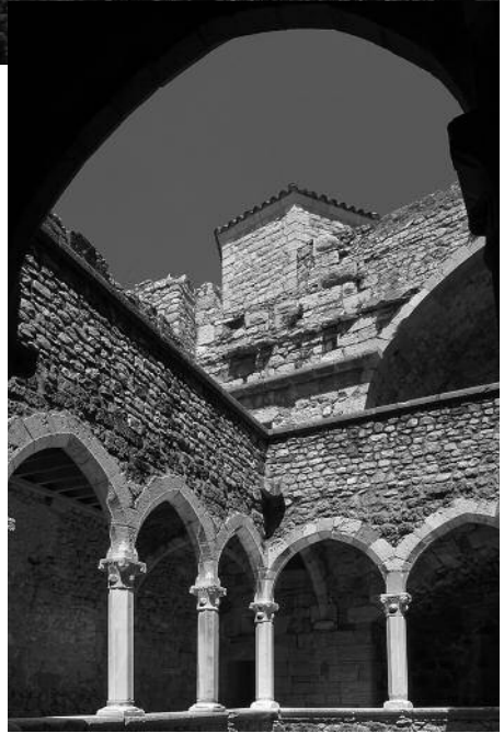
Déambulatoire de l'ancienne abbaye fortifiée de l'Île Saint-Honorat, face à l'Abbaye Notre-Dame de Lérins

Pour les déplacements à destination, nous avons, une fois encore, opté pour le plan achat-rachat Renault au lieu de louer une voiture. Cette formule a de multiples avantages: la voiture est neuve et, chaque fois, on obtient le dernier modèle muni des plus récents équipements. Le prix comprend le kilométrage illimité, l'assurance multirisque sans franchise et l'assistance routière en tout temps. Parmi les 11 modèles, c'est la Renault Cléo 1,5 dCi diesel de 80 ch, 5 vi-