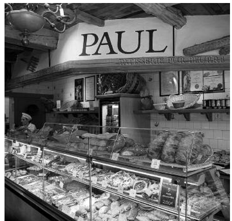
La fameuse boulangerie Paul