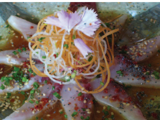
Soleil levant de poisson cru retour de Forville, Salade d'orge perlé aux saveurs nippones du restaurant L'Oasis

voir attendre! Les gens n'ont plus de repères avec les produits en vente toute l'année. Lorsque vous allez au resto, vous devez être surpris. Si c'est pour manger au quotidien, c'est inutile.»