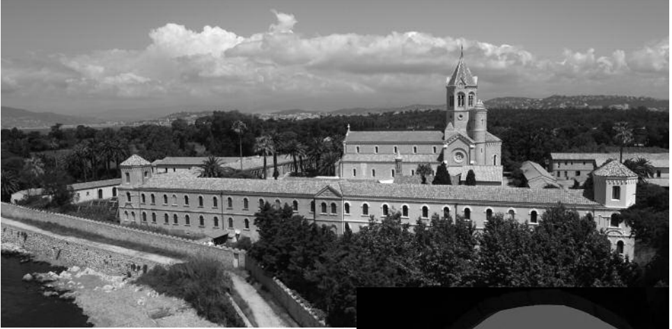
Abbaye Notre-Dame de Lérins sur l'Île Saint-Honorat