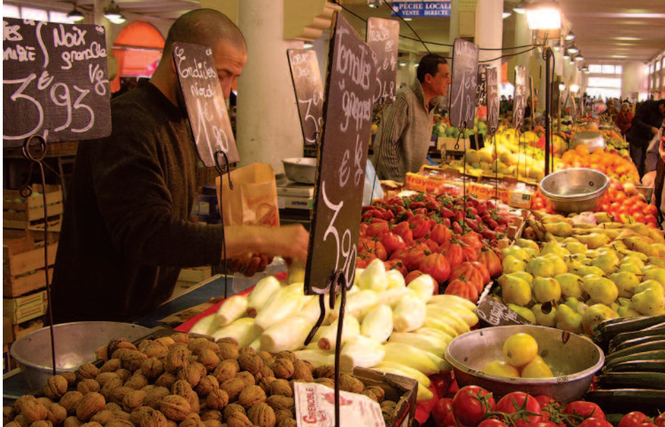
Marché Forville

Cannes. On y trouve un nombre impressionnant de palaces comme le Carlton, le Martinez et le Miramar, d'hôtels particuliers, de résidences élégantes, de boutiques de luxe, de restaurants hors de prix et des plages privées où l'on rencontre des célébrités de tous les calibres.