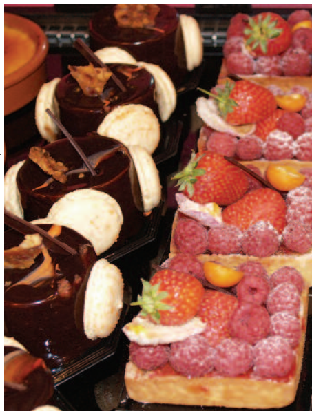
Pâtisseries de la Chocolaterie et pâtisserie Jean-Luc Pelé