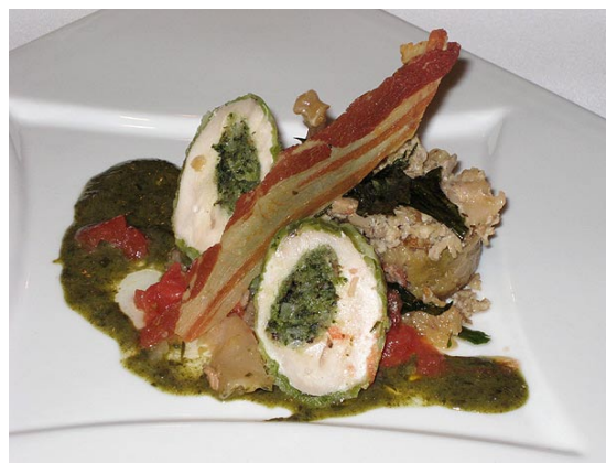
Perdrix au chou

Photos sur www.debeur.com/PrixDebeur2007.html