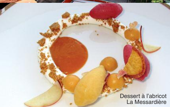
Dessert à l'abricot La Messardière