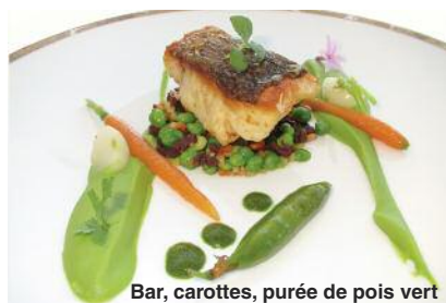
Bar, carottes, purée de pois vert

Un complexe hôtelier recherché, au charme mi-rococo mi-moderne et d'influence mauresque, culminant au sommet d'une colline qui domine la plage de Pampelone, côté terrasse; Saint-Tropez et sa baie, côté piscine. Beau, chic et cher! Nous y avons dégusté un bon repas, les yeux rivés sur la pinède et la mer.