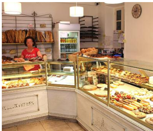
Boulangerie-pâtisserie Aux deux frères