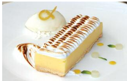
Citron en tarte meringuée