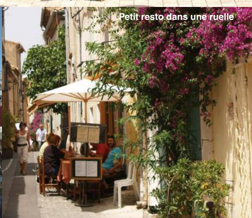
Petit resto dans une ruelle