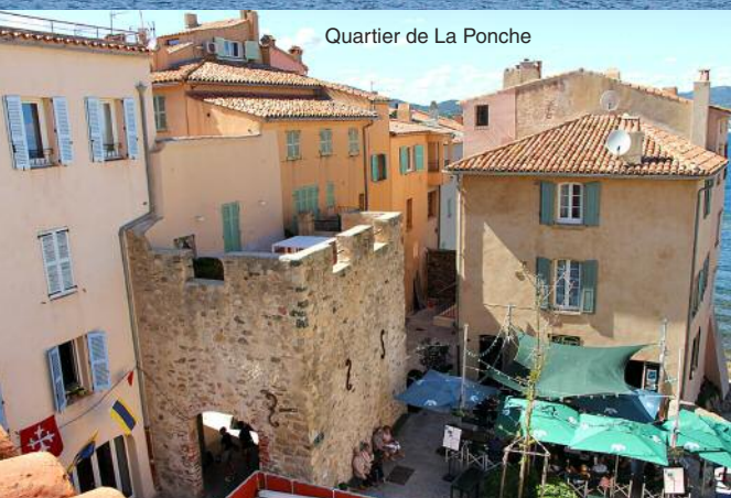
Quartier de La Ponche