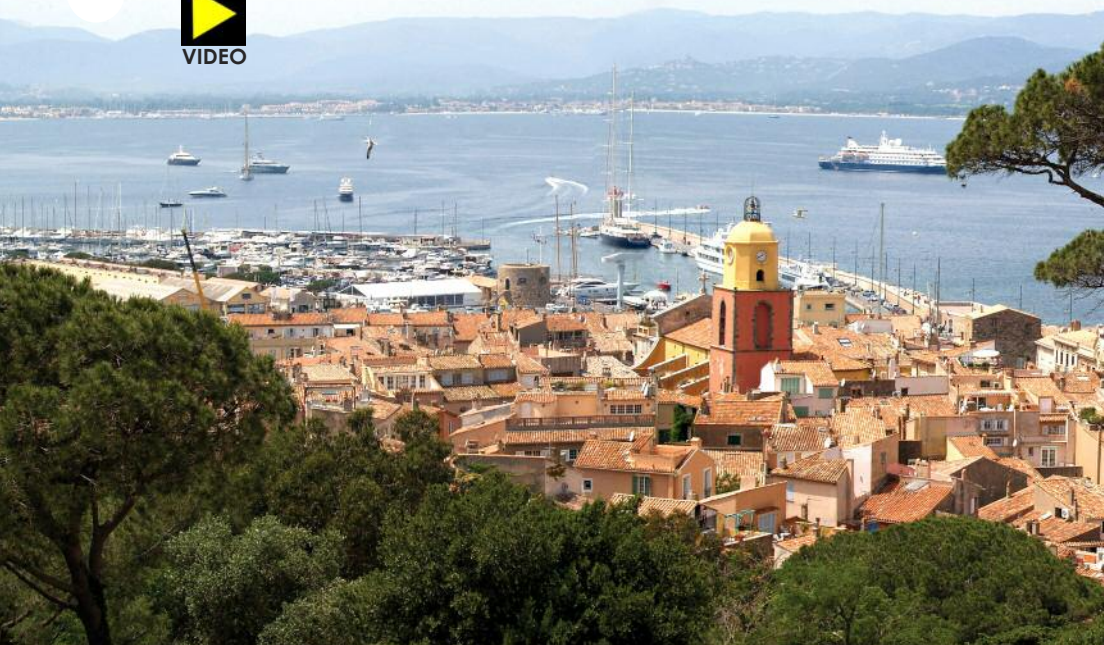
Vue générale de Saint-Tropez et de son port, prise de la Citadelle