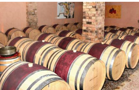
Cave du Château des Marres

Parmi ses produits, on remarque bien sûr la cuvée Pétale de rose , un rosé exceptionnel, très pâle, élégant et féminin, ainsi que le Château Barbeyrolles , soyeux et charpenté à la fois, long en bouche. Celui-ci est un grand vin rouge de Provence; seuls les grands millésimes sont mis en bouteille. Ces deux vins sont en vente à la SAQ.