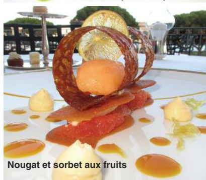
Nougat et sorbet aux fruits