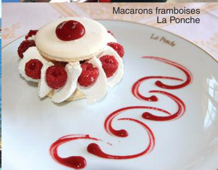
Macarons framboises La Ponche