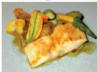
Loup sauvage, courgettes fleurs