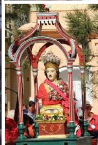
La Bravade et le buste de saint Tropez