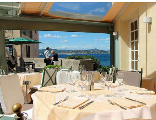
Terrasse couverte de l'hôtel La Ponche installée au même endroit qu'au temps du Bar de la Ponche

gnac, Bonnard, Matisse, Picasso et plus récemment Jacques Cordier l'ont peinte sous tous ses angles.