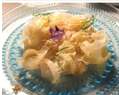
Seriole (poisson) mariné dans le citron et le fenouil