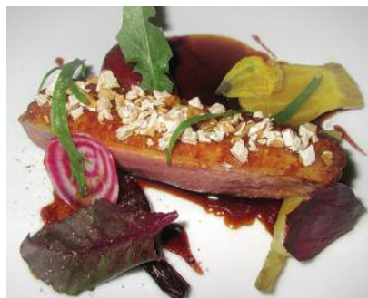
Poitrine de canette, betteraves et navets au nougats