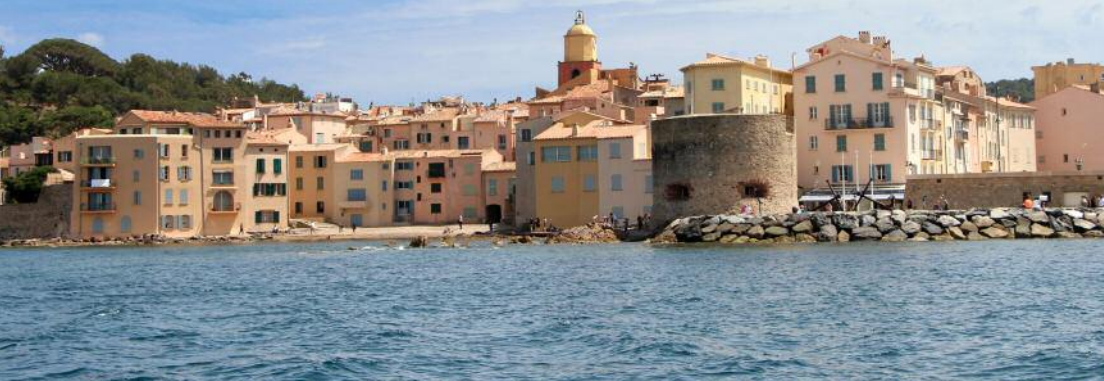
Saint-Tropez vue de la mer (Photo prise à bord du Brigantin II )

bouillabaisse marseillaise par exemple. On peut considérer que la bouillabaisse est un plat typiquement tropézien!