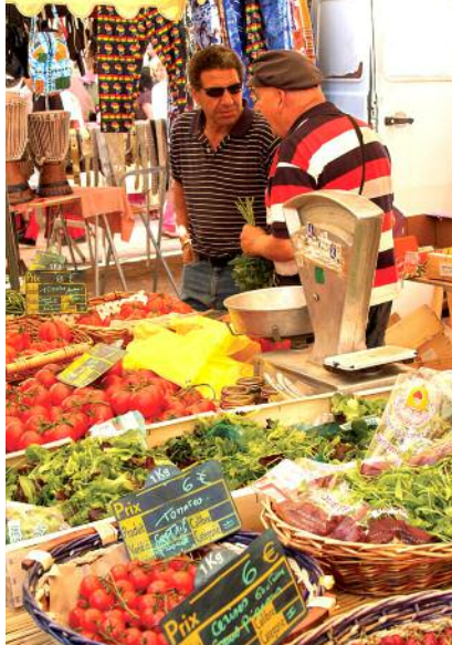
Marchand de fruits et légumes