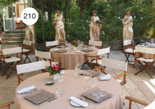
Terrasse de La Table du Mas