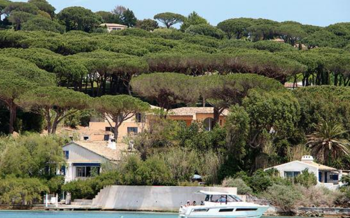
La Madrague de Brigitte Bardot