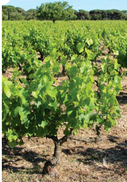
Vignoble La Ferme des Lices