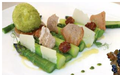
Asperges vertes, galette de blé noir, oeuf bio, jus de riquette