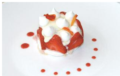
La fraise en vacherin

Une cuisine méridionale revisitée avec des produits frais de la région, déclinés de plusieurs façons. Une excellente assiette! On mange sur une jolie terrasse ombragée au bord de la piscine. Décor romantique, service stylé mais pas emprunté.