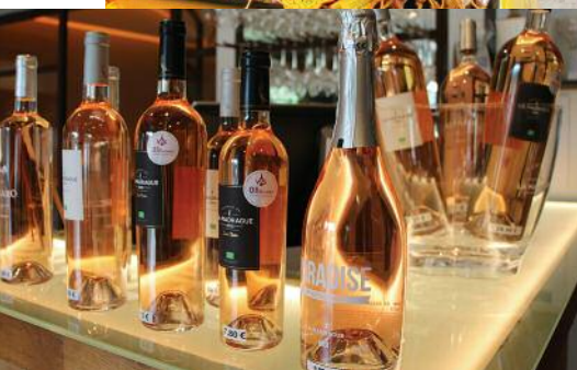
Gamme de vins rosés, Domaine de La Madrague

Nous avons acheté nos billets à l'agence Voyages Océane 450-444-3100 ou 866-644-3100 www.voyageoceane.com