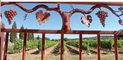
Château des Marres