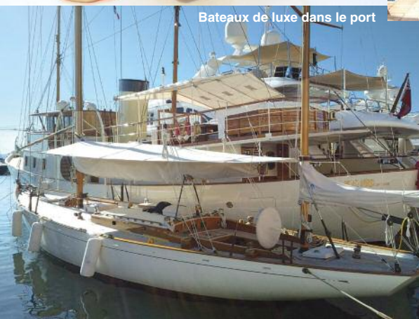
Bateaux de luxe dans le port