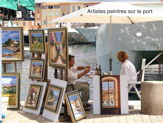
Artistes peintres sur le port